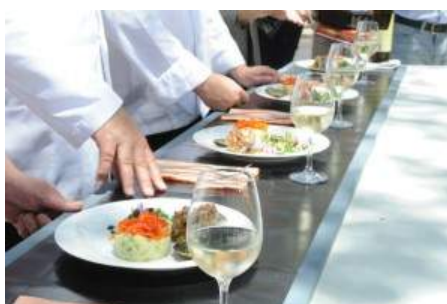
Concurso deste ano tem estágio no hotel The Yeatman como prémio final.

Os interessados na competição culinária que terá exibição em Julho na RTP-M, em programas com apresentação de Paulo Santos e que serão gravados já em Maio, deverão consultar o regulamento disponível em www.fn-hotelaria.pt .